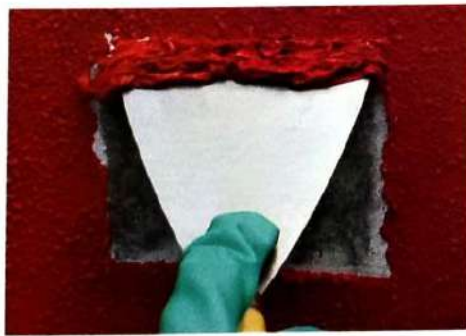
5. Rontokan cat dengan kape