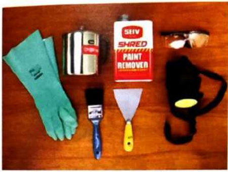
1. Siapkan peralatan