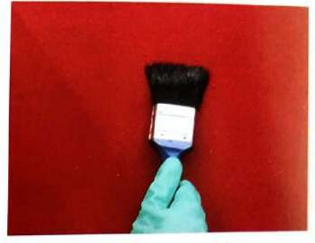
3. Aplikasikan dengan kuas