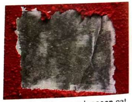
6. Hasil akhir pengelupasan cat