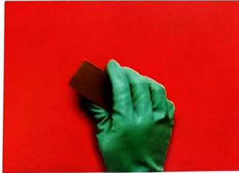
2. Bersihkan permukaan substrat