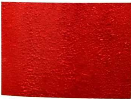
4. Tunggu menggelembung / melunak