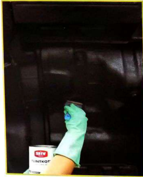
2. Aplikasikan dengan merata.