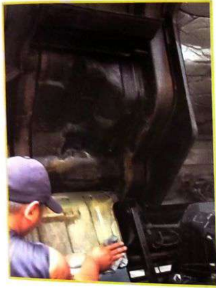
1. Bersihkan area permukaan